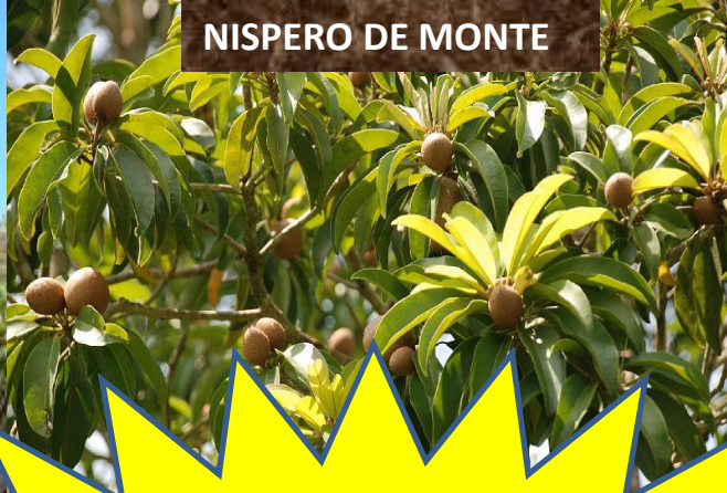
NISPERO DE MONTE