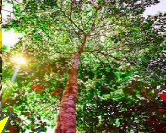
SANGRE DE GRADO